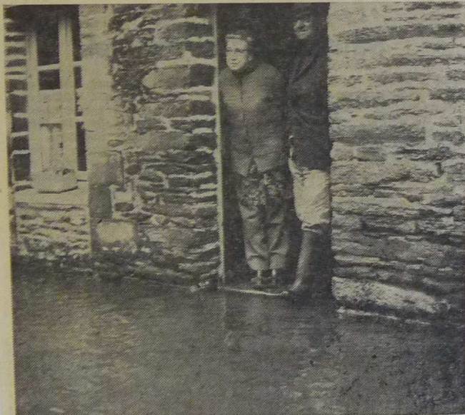
A GOUAREC. — Quelques centimètres de plus et la maison sera inondée. Ici on veille...

A Gouarec, on tire à nouveau la sonnette d'alarme. La pluie tombée dans la nuit du 14 au 15 a déjà produit ses effets. On mesure un mètre d'eau dans les maisons du quartier de la rue au Lin. On ne passe plus de Gouarec à Pléauiff. L'accalmie aura été de bien courte durée pour les sinistrés qui commencent à panser leurs plaies, chacun s'affairant à refaire son chez soi avec la pensée que c'était bien fini. Mais vendredi dans la matinée, l'eau s'est remise à monter pour atteindre le niveau des halles.