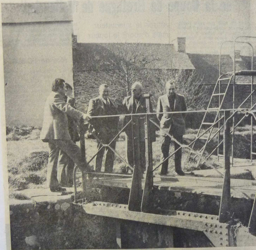
A Gouarec, sur les bords du canal.